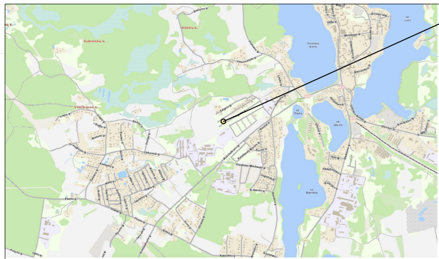
KOREGUOJAMO DETALIOJO PLANO TERITORIJA