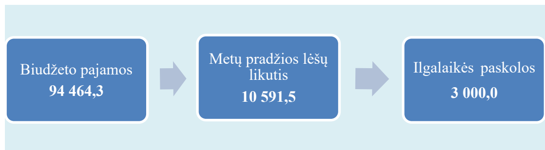
2 pav. 2025 m. Savivaldybės biudžeto piniginės lėšos tūkst. Eur.

Pagal Fiskalinės drausmės įstatymą 16 valdžios sektoriaus finansai tvarkomi siekiant, kad vidutiniu laikotarpiu valdžios sektorius būtų perteklinis, o pagal Fiskalinės sutarties įgyvendinimo konstitucinį įstatymą 17 Savivaldybės biudžetas turi būti planuojamas, tvirtinamas, keičiamas ir vykdomas taip, kad pagal biudžeto struktūrinį balanso rodiklį, apskaičiuotą kaupiamuoju principu, jis būtų perteklinis arba subalansuotas.