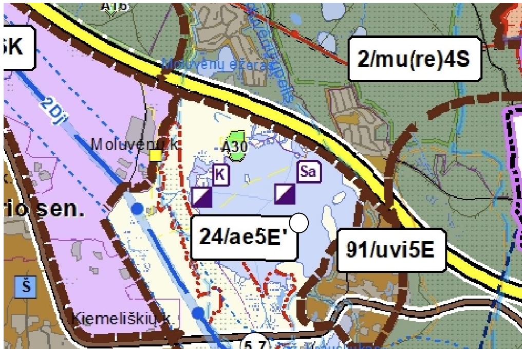
Trakų rajono savivaldybės teritorijos bendrasis planas

Pagal Trakų rajono savivaldybės teritorijos bendrąjį planą, planuojama teritorija patenka į planuojamą kompaktiško užstatymo gyvenamąją zoną.